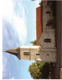
Eglise gallo-romaine "Saint-Cloud"

8 Passer le lieu-dit de la Senve, tourner à gauche après l'étang (balisage GR), et remonter jusqu'à la demeure du Fermigier. Prendre à gauche et suivre le chemin forestier du Fermigier jusqu'à la RD (tout en admirant sur votre gauche la croix du Fermigier),