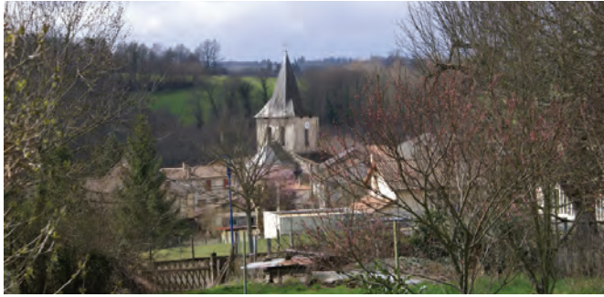
Le bourg de Champagnac-la-Rivière

10 Suivre la route à gauche et descendre vers le bourg de Champagnac-la-Rivière, point de départ du circuit.