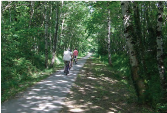
La voie verte des Hauts de Tardoire

La voie verte des Hauts-de-Tardoire relie Chalus à Oradour-sur-Vayres. D'une longueur de 13 kilomètres, elle chemine dans une nature préservée, où rollers, personnes à mobilité réduite, randonneurs, cyclistes, peuvent se promener sur un lieu agréable et sécurisé. La voie Verte est interdite aux véhicules motorisés et aux équestres.