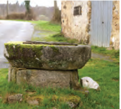
Aux Jarasses, découvrez le puits à margelle monolithe, le bloc à terre et une grange du XVIIème.