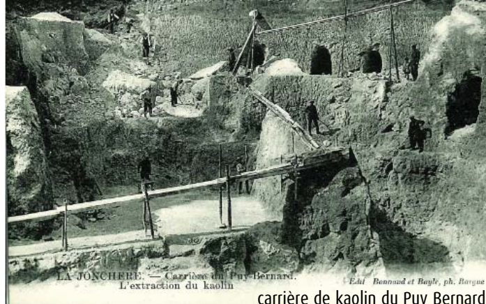
LA JONCHERE. — Carrières du Puy-Bernard. — Edit. Bonnaud et Bayle, ph. Bayque carrière de kaolin du Puy Bernard