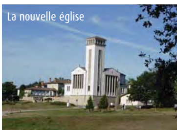
La nouvelle église

La nouvelle église : inaugurée en 1953, l'église est un monument majeur par sa symbolique, son implantation et son architecture. Sa position stratégique à l'entrée du nouveau bourg est accentuée par sa linéarité avec l'église du village martyr. Les vitraux de Chigot et la statue de Saint-Victurien, classée Monument Historique, en font un site très intéressant.