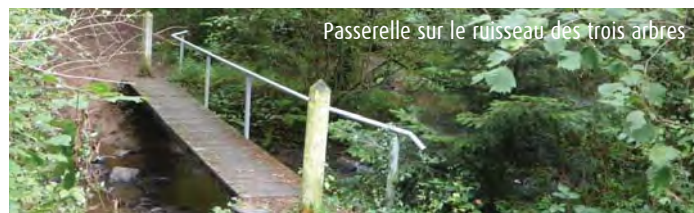
Passerelle sur le ruisseau des trois arbres

Variante 2 : prendre à droite le chemin creux qui descend, traverser le ruisseau des trois arbres. Grimper puis prendre à droite. Au prochain carrefour, continuer tout droit vers la Métairie. A la route, tourner à gauche puis la 1ère à droite. Rejoindre le point de départ du circuit.