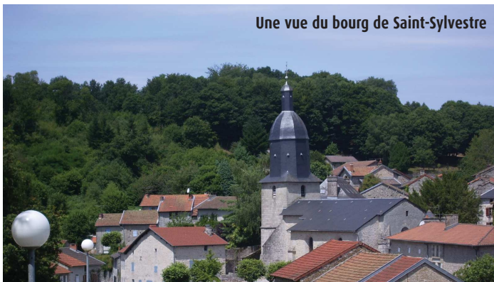
Une vue du bourg de Saint-Sylvestre