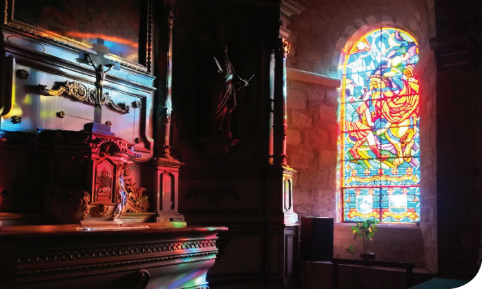
Eglise St Michel