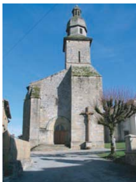
Eglise de Rancon

Isolée dans un vallon, près d'une bonne fontaine à dévotions, cette chapelle du XIX ème siècle voit se dérouler chaque année un pèlerinage en l'honneur de son saint patron, fin août.