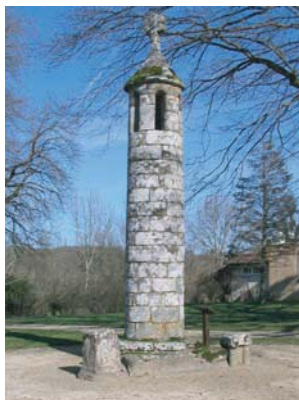
Lanterne des morts de Rancon

Située à proximité de l'église, sur la place publique (ancien cimetière), cette lanterne date du XII ème siècle. Elle possède un pilier creux en pierre, en haut duquel était placé au Moyen-Age, un fanal allumé (symbole de la vie éternelle) chargé de veiller sur le cimetière. Au sommet de cet édifice se trouve une jolie niche ajourée, surmontée d'une croix.