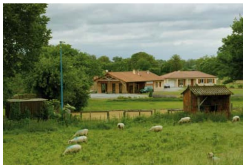
Une vue de la campagne proche du bourg

Bonne fontaine Saint-Martial, à la sortie du bourg en direction de Châteauponsac, cette fontaine votive est accompagnée d'un lavoir. Ses vertus étaient contraceptives dit-on, mais aussi elle aidait à la guérison du bétail. La procession a lieu pour la Saint-Martial, qui rappelons-le est l'évangéliste de la Limousin et le premier évêque de Limoges.