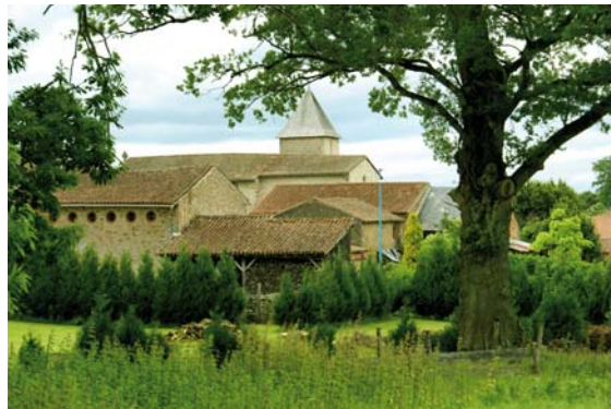
Eglise de Roussac