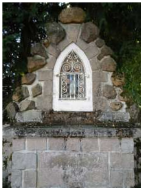
Le site de la vierge