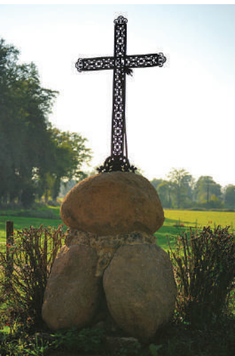
La croix du méchant

8 Arrivé à la RD11A, la prendre à gauche et la suivre jusqu'au bourg de Condat-sur-Vienne. Rejoindre le point de départ.