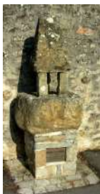
Face à l'école, un coffre funéraire, sépulture gallo-romaine du IIème siècle, fut découverte dans un champ.

7 Au bout de la digue, remonter la rue Saint-Fortunat en direction du bourg. Longer le jardin du presbytère à gauche, puis le refuge pour les pèlerins de Saint-Jacques-de-Compostelle. Arrivé à l'église, prendre à gauche la rue Pasteur puis la 1ère rue à gauche pour retrouver le point de départ du circuit.